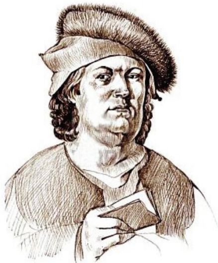
Theophrastus Bombastus Von HOHENHEIM ou PARACELSO (1493-1541)