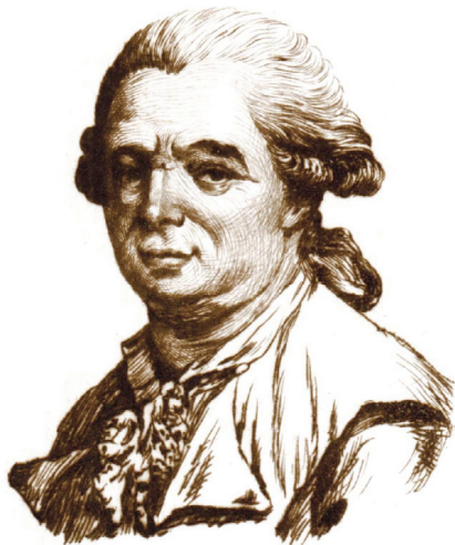
Franz Anton MESMER (1734-1815)

várias décadas o que veio a ser estudado pelo hipnotismo, espiritismo e pela parapsicologia".