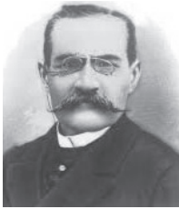
Léon Denis (1846-1927)

Penseur spirite français, auteur de plusieurs œuvres spirites, considéré comme "l'apôtre du spiritisme".