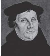
Martin Luther (1483 - 1546)

Moine augustinien et professeur de théologie allemande, il est devenu l'une des figures centrales de la Réforme protestante.