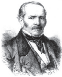
Allan Kardec (1804-1869)

Pseudonyme d'Hippolyte Léon Denizard Rivail, pédagogue français, écrivain et fondateur du spiritisme.